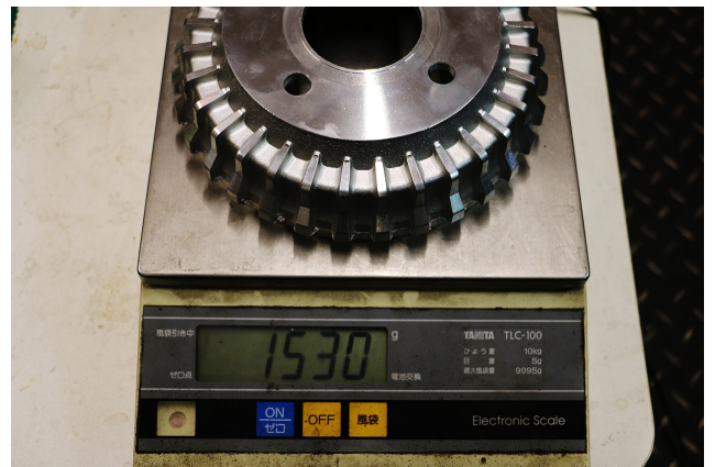
アルフィンドラム：1,530g

□製造元 HAYASHI RACING □販売元 TAKE OFF Co.,Ltd